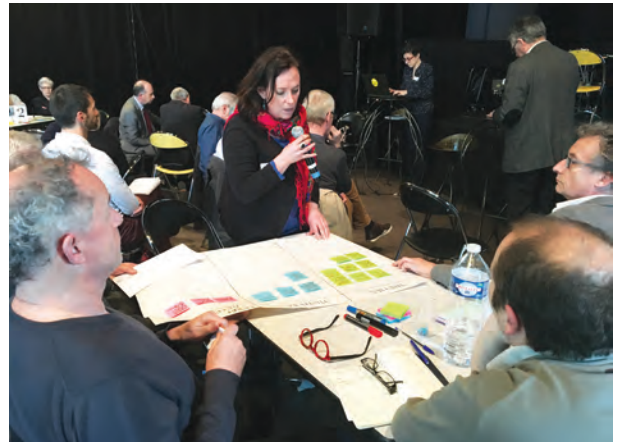
Séminaire d'accueil du Codev - 5 avril 2017.

Le Codev poursuivra et renforcera ses coopérations en subsidiarité avec les autres niveaux et instances de participation. (par exemple Ceser Bretagne, comités consultatifs du Conseil départemental, comités d'usagers thématiques, Fabrique citoyenne de la ville de Rennes, comités citoyens du contrat de ville...).