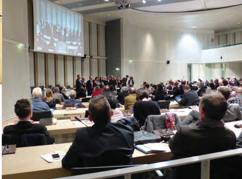
Séance plénière d'installation du Conseil de développement de la métropole de Rennes - 7 mars 2017.

➔ Par exemple, en 2017 le réseau des conseils de développement bretons organise plusieurs formations collectives pour les bénévoles des conseils de développement bretons : sur le thème de la prospective, de la construction d'avis ou de l'évaluation des politiques publiques.