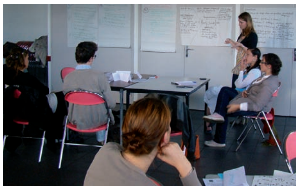
Les jeunes ont travaillé en atelier sur les thèmes de l'insertion et l'emploi, de la dynamique culturelle ou encore de la mixité sociale.

Trois rencontres prospectives ont ainsi été organisées. Riches de débats et de partages, elles ont permis aux quinze volontaires de préciser plusieurs envies communes et prioritaires à leurs yeux : des espaces publics réinvestis et gérés collectivement, moins de rupture entre le monde des étudiants, des professionnels et des retraités, une agglomération verte, écologique, à l'architecture à la fois respectueuse du patrimoine et innovante, etc. In fine, une métropole rennaise permettant aux citoyens d'être pleinement acteurs de l'avenir de leur territoire.